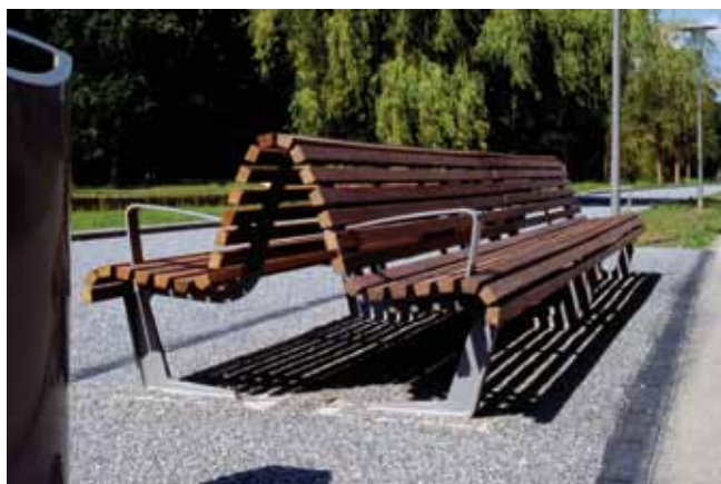
Rugleuningen tegen elkaar geplaatst